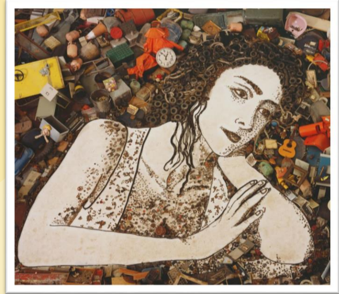
Lixo Extraordinário, Vik Muniz, 2008

Olhe com atenção essas imagens. De que materiais elas foram feitas? Você já tinha imaginado que esses materiais poderiam virar uma obra de arte?