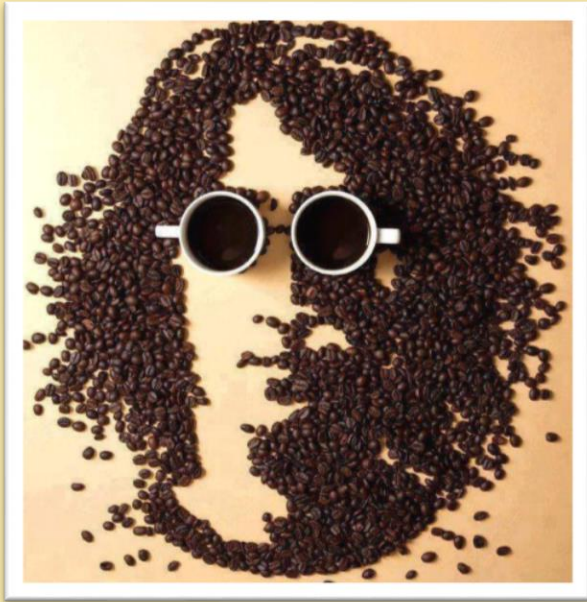
John Lennon, Vik Muniz