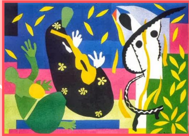
Henri Matisse "A Tristeza do Rei" (1952)