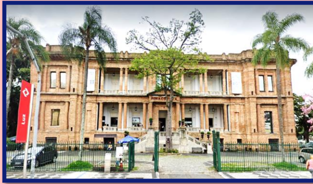
Pinacoteca do Estado de São Paulo

é uma instituição permanente, sem fins lucrativos, aberta ao público e que adquire, conserva, investiga, difunde e expõe as obras feitas pelo ser humano, para educação e diversão da sociedade.