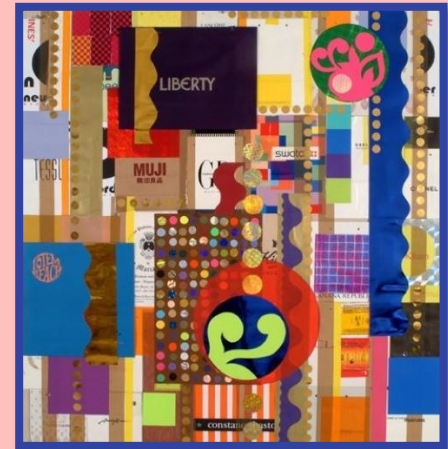
Beatriz Milhazes "Liberty" (2007)