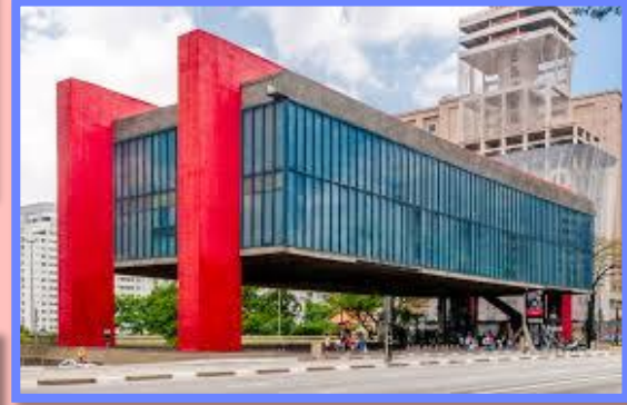
Museu de Arte de São Paulo Assis Chateaubriand MASP