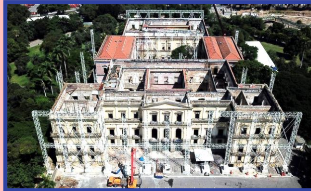
Museu Nacional do Rio de Janeiro incendiado em 2018