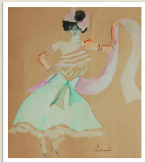
“A Rainha do Pierrete” Estudo de figurino para o balé “Carnaval das Crianças Brasileiras”. Di Cavalcanti, 1920. (imagem disponível em Google Arts & Culture)