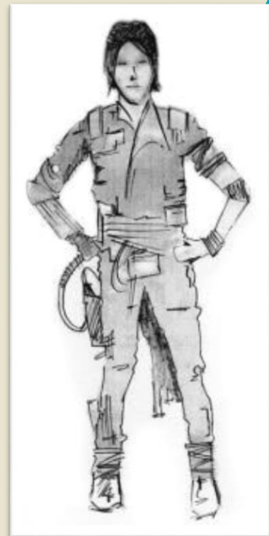
O figurino de Daisy Ridley em Star Wars: Episódio VII

Guarde seu desenho para mostrar aos colegas e professor.