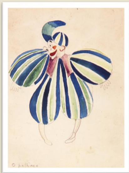
“O palhaço” Estudo de figurino para o balé “Carnaval das Crianças Brasileiras”. Di Cavalcanti, 1920. (imagem disponível em Google Arts & Culture)

Di Cavalcanti, artista plástico brasileiro, em 1920 desenhou os figurinos para o espetáculo “O Carnaval de Todas as Crianças” de Heitor Villa-Lobos, observe as imagens.