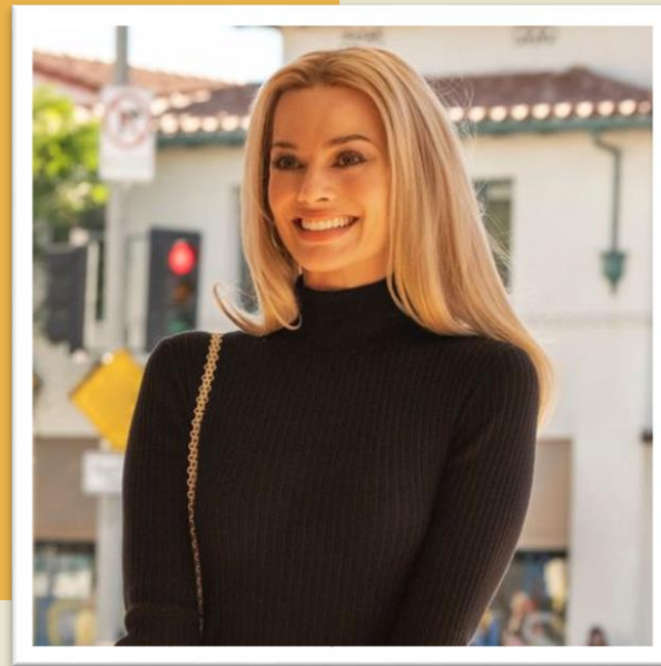
Atriz Margot Robbie (imagem da internet)

Na primeira foto a atriz Margot Robbie está caracterizada como a personagem Arlequina e na segunda foto como ela é no dia a dia.