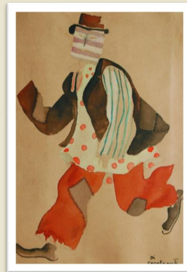
“As traquinices do mascarado mignon” Estudo de figurino para o balé “Carnaval das Crianças Brasileiras”. Di Cavalcanti, 1920.

Você já tinha escutado falar do artista Di Cavalcanti?