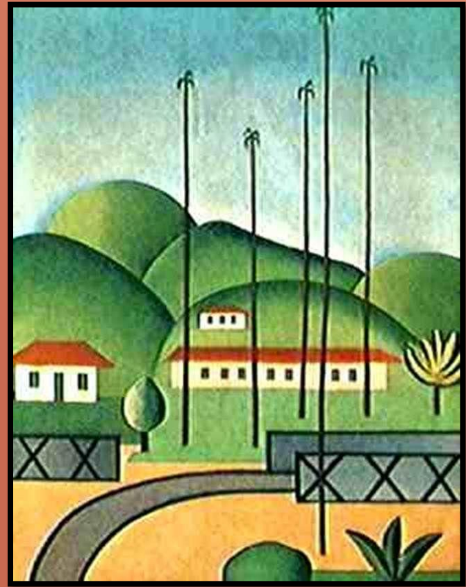
PALMEIRAS (1925), serigrafia de Tarsila do Amaral

3. O que você pensa ao analisar esta obra?