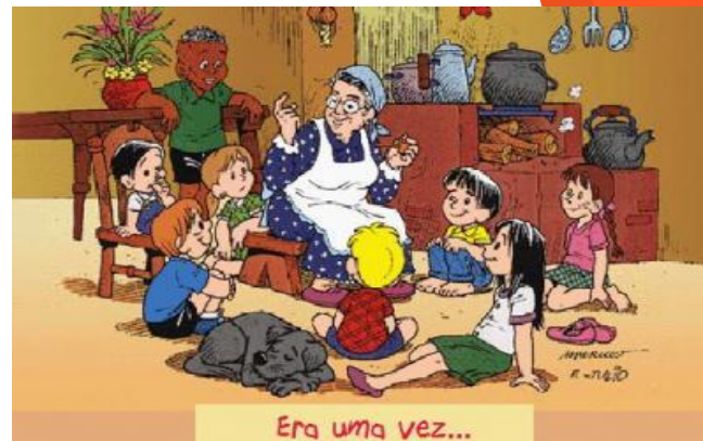
Era uma vez...