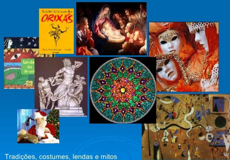
Tradições, costumes, lendas e mitos

Imateriais: são as práticas, representações, expressões, conhecimentos e técnicas. Os saberes, os modos de fazer as formas de expressões, celebrações, as festas e danças populares, lendas, músicas, costumes, etc.