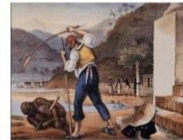
Desenhos e pinturas