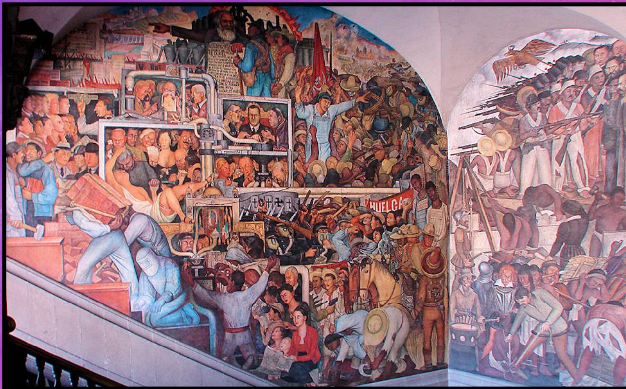
Epopeia do Povo Mexicano ou A História do México (1929) no Palácio Nacional do México, de Diego Rivera

Para dar andamento ao seu projeto de arte, Vasconcelos Calderón convidou três artistas: Diego Rivera (1886-1957), David Alfaro Siqueiros (1896-1974) e José Clemente Orozco (1883-1949). Eles ficaram conhecidos como “os três grandes”.