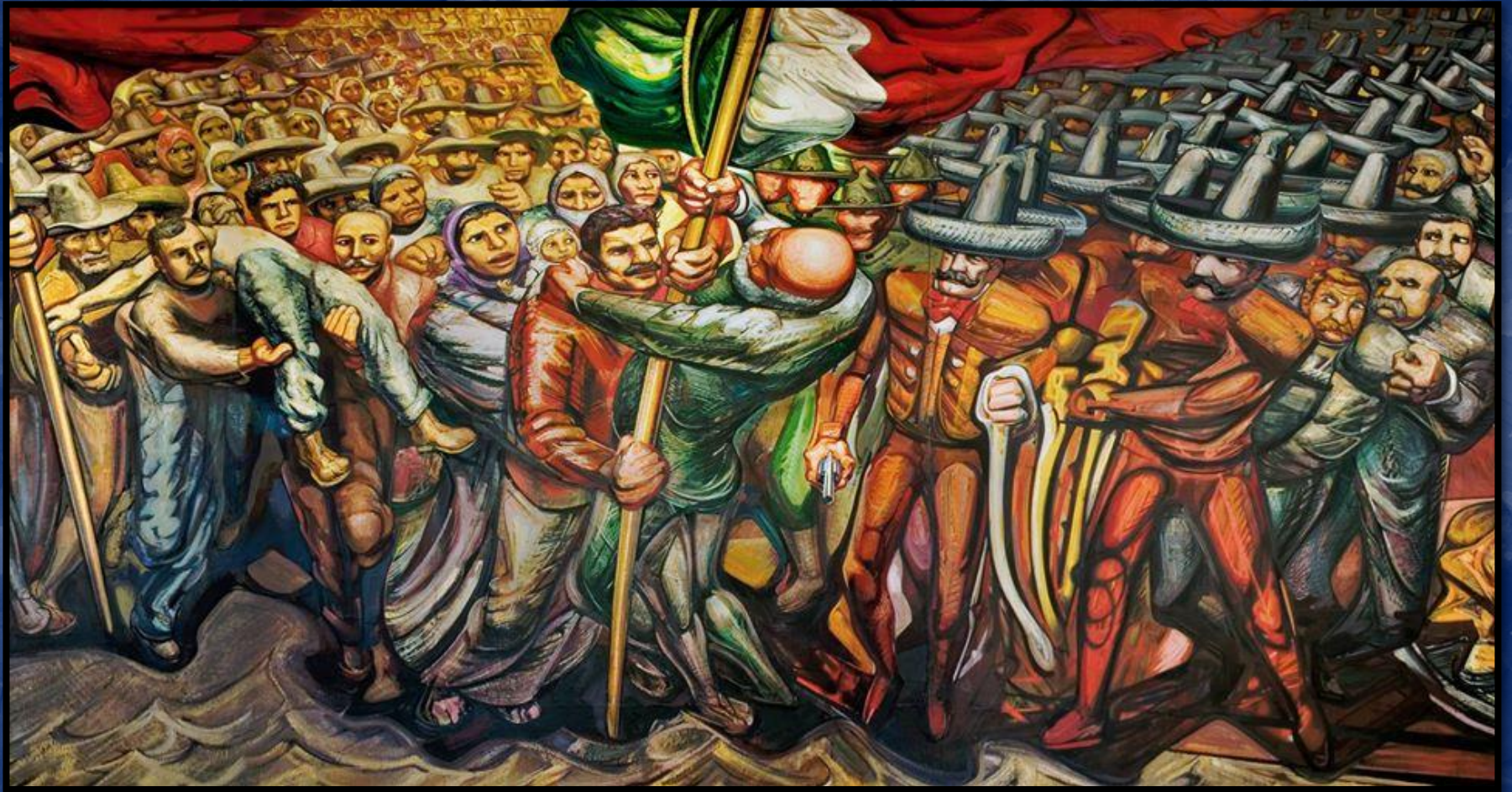
“Do Porfirismo à Revolução”, de David Alfaro Siqueiros