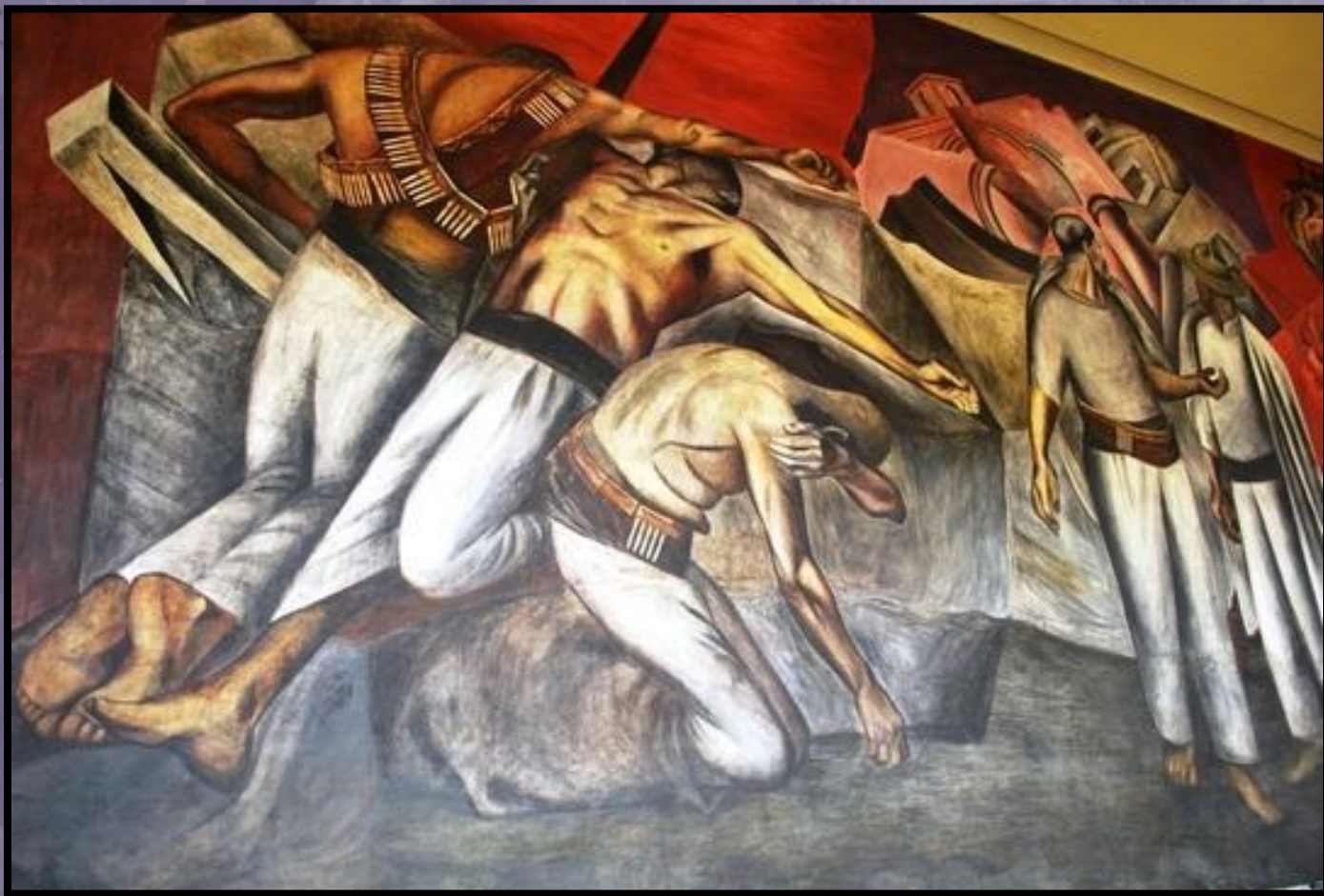
Mural da Trincheira (1926) José Clemente Orozco