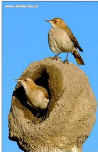
Figura 1 - João de Barro Disponível em: < http://www.ninha.bio.br/biologia/joao-de-barro.html >

João-de-barro - Lendas e Mitos. Só História. Disponível em < http://www.sohistoria.com.br/lendasemitos/joaodebarro/ >. Acesso em 28.mar.2020.