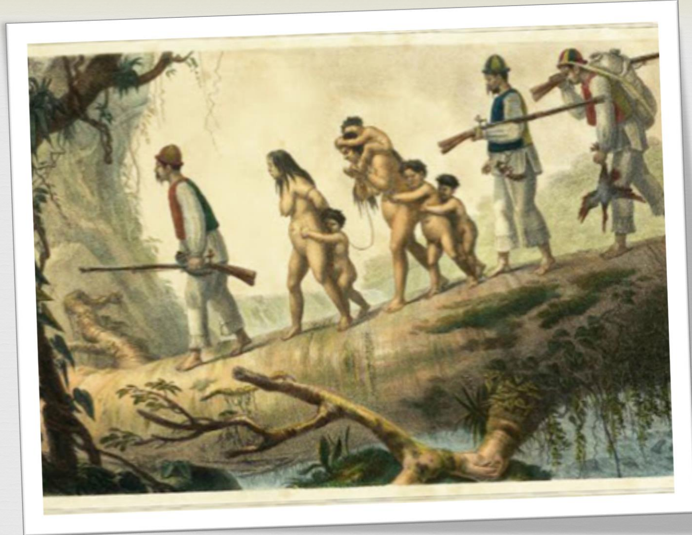
Litografia de Jean-Baptiste Debret, 1835. Domínio público, Biblioteca Digital Luso-Brasileira

Soldados-índios civilizados aprisionam índios selvagens na província de Curitiba. Cenas como esta só foram possíveis porque os indígenas eram aculturados e destruídos por meio da catequese.