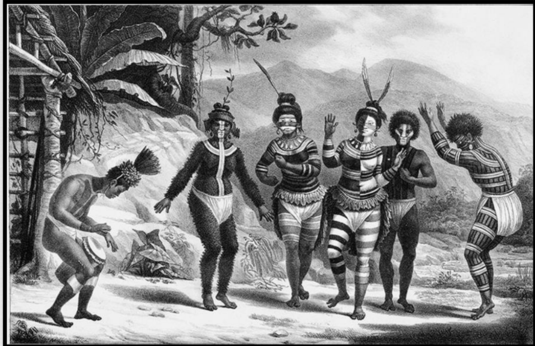
Dança de selvagens da missão de São Jose (1834) gravura de Jean Baptiste Debret