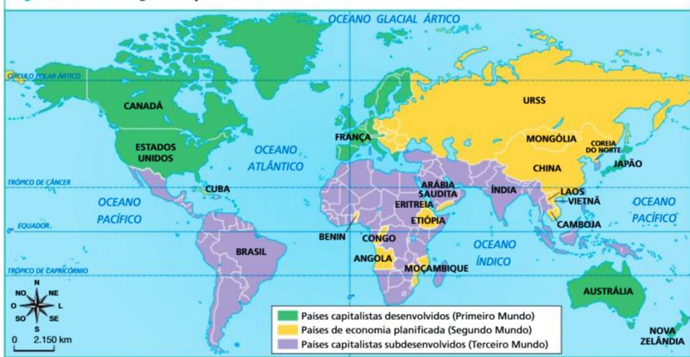
Figura 16. Mundo: regionalização com base no sistema socioeconômico – 1952-1991

Fonte: Guia do Terceiro Mundo 1989-1990. Rio de Janeiro: Terceiro Mundo, 1990. p. 23.