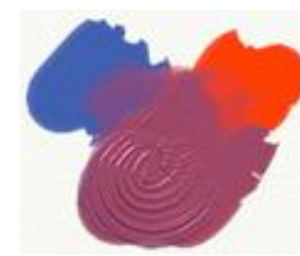
(Azul + Vermelho) Violeta

https://saojose.com.br/wp-content/uploads/2014/06/secund%C3%A1rias.JPG