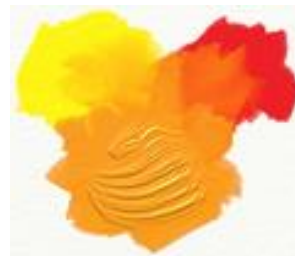
(Amarelo + Vermelho) Laranja