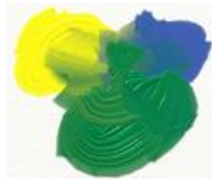
(Amarelo + Azul) Verde

O verde, o laranja e o roxo são cores secundárias. Cada uma delas é formada pela mistura de duas primárias.