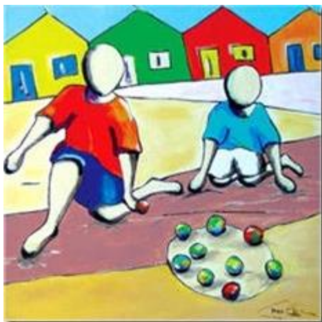
Bola de gude