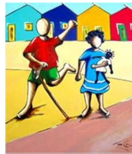
Cavalinho e boneca