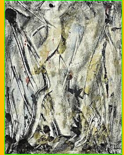
No Brasil; Monotipia sobre papel Vicente do Rego Monteiro 1965