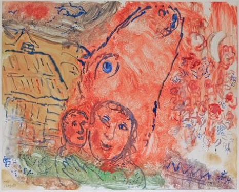
Monotipia em papel japonês Marc Chagall - 1965