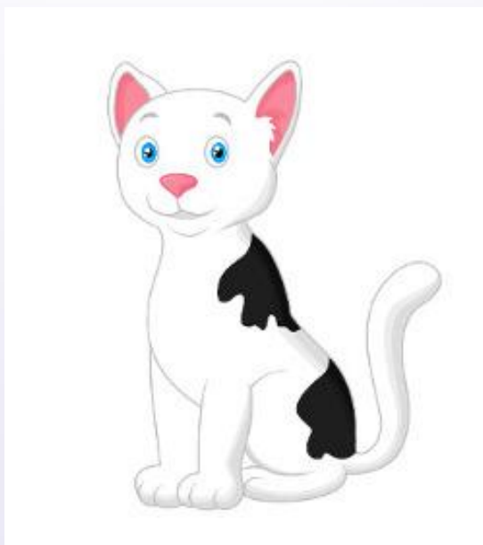
Gato (Gátô) Gato