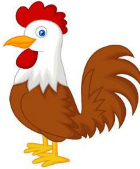
Gallo (Galhô) Galo