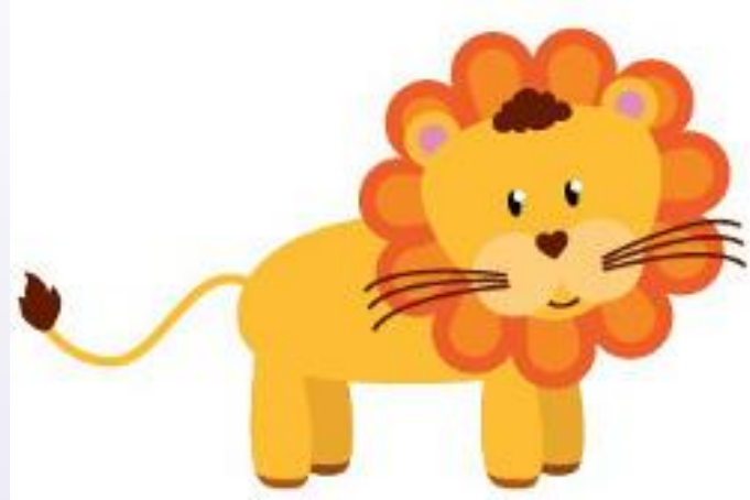
León (Leñn) Leão