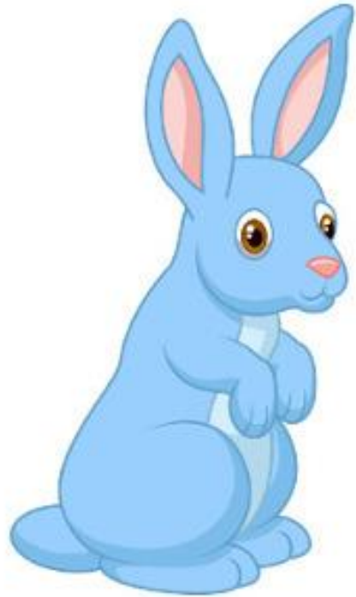
Conejito (Conerrítô) Coelho