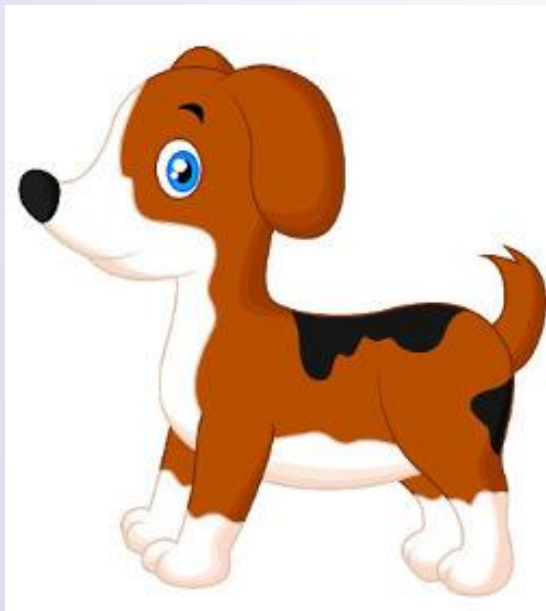
Perro (Pêrrô) Cachorro

Vamos conhecer alguns nomes de animais em espanhol?