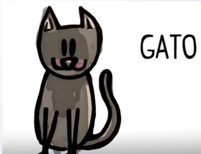
Gato (Gátô) Gato