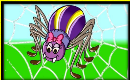
3 - A ARANHA