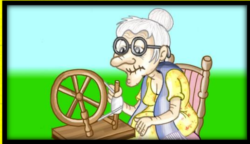
1 - A VELHA

ENTÃO, VAMOS CONHECER OS PERSONAGENS NA SEQUÊNCIA???