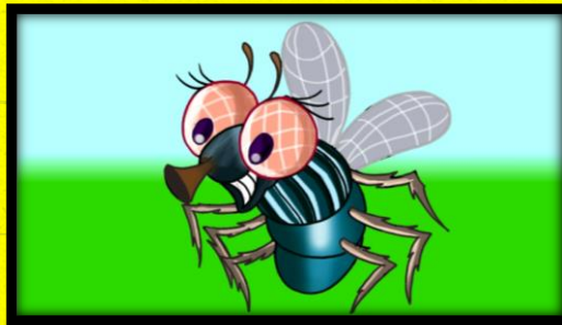
2 - A MOSCA