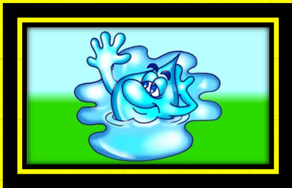
9 - A ÁGUA