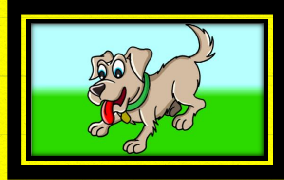
6 - O CACHORRO