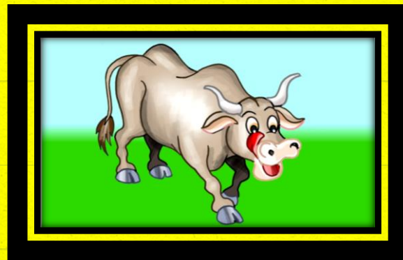
10 - O BOI