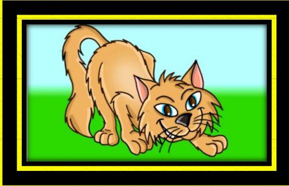
5 - O GATO