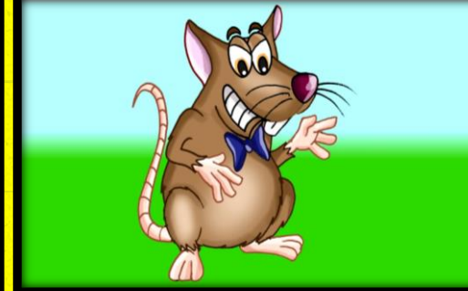
4 - O RATO