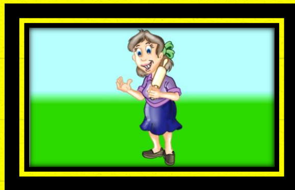
12 - A MULHER