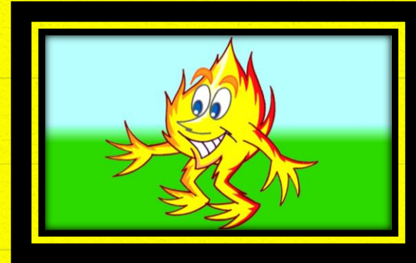
8 - O FOGO