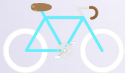
Bicycle (Báicicou) Bicicleta