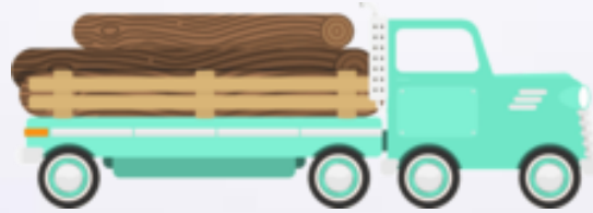
Truck (Trãc) Caminhão