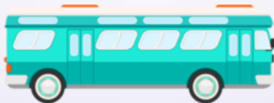
Bus (Bâz) Ônibus