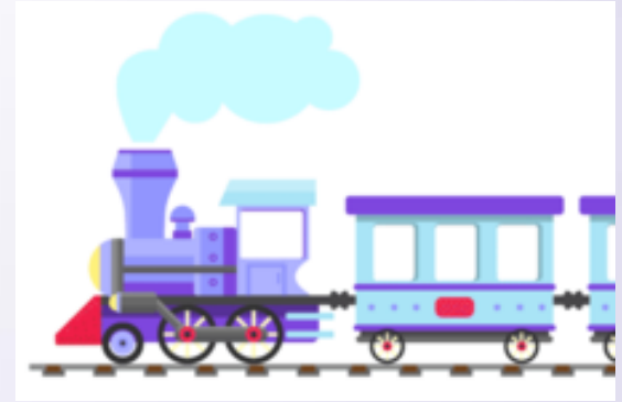
Train (Trãin) Trem