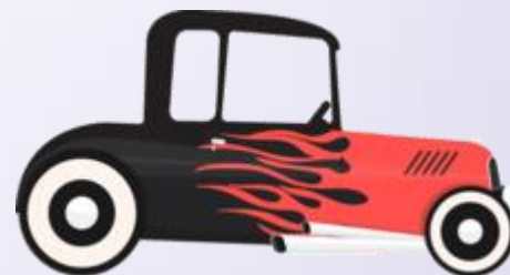
Car (Cár) Carro