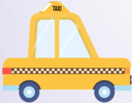
Taxi (Taxí) Táxi