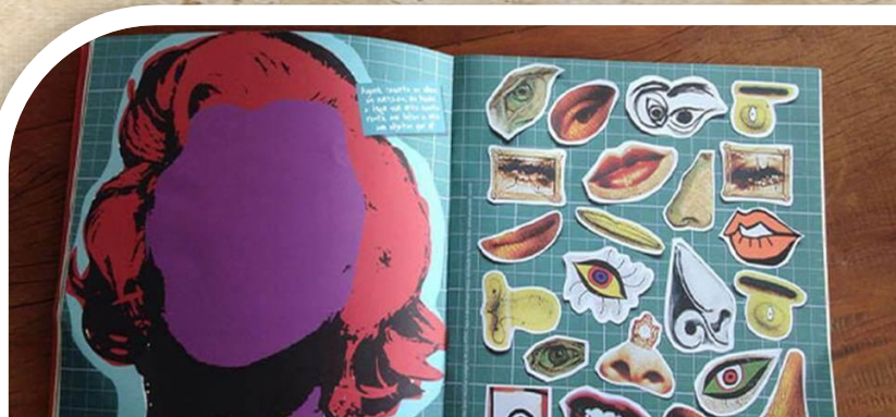
Retratos curiosos com crianças