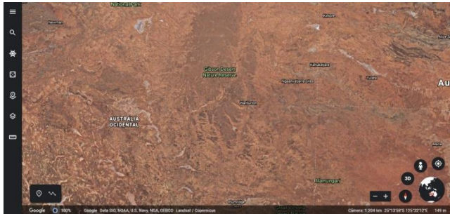
Utilizando clique duplo

É bem simples! Após acessar o Google Earth, podemos conhecer os lugares com dois cliques sobre o planeta ou digitando o nome do local para onde se deseja ir na ferramenta de pesquisa.