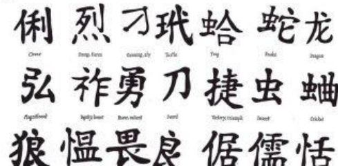
Alguns ideogramas em mandarim