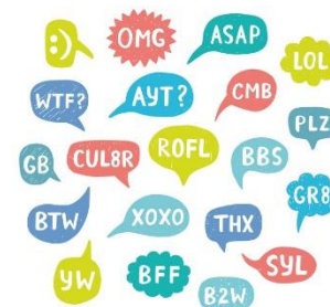
Algumas siglas em inglês

- Hindi: cerca de 487 milhões de pessoas utilizam esse idioma, que é o oficial da Índia e é falado por 18% do contingente populacional indiano.