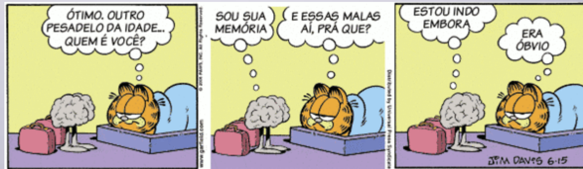
Tirinha idêntica, mas com a tradução para português