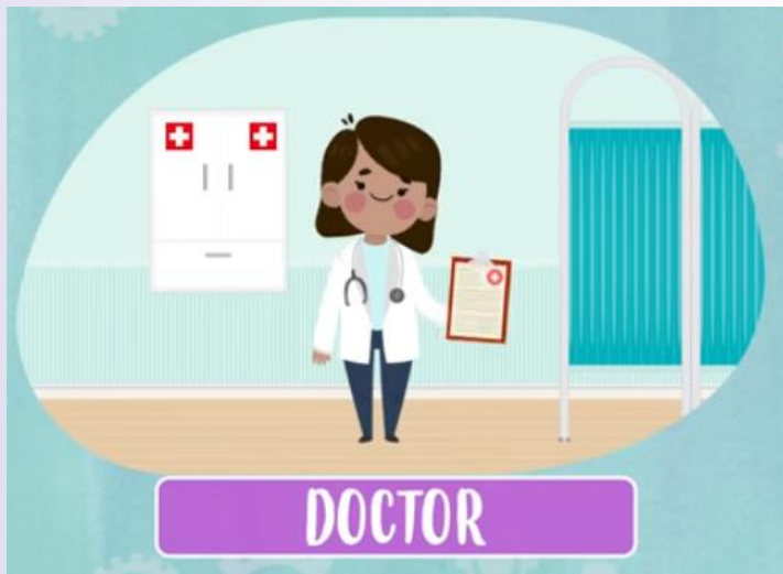
Doctor ( falamos "dóquitor" ) Doutor(a)