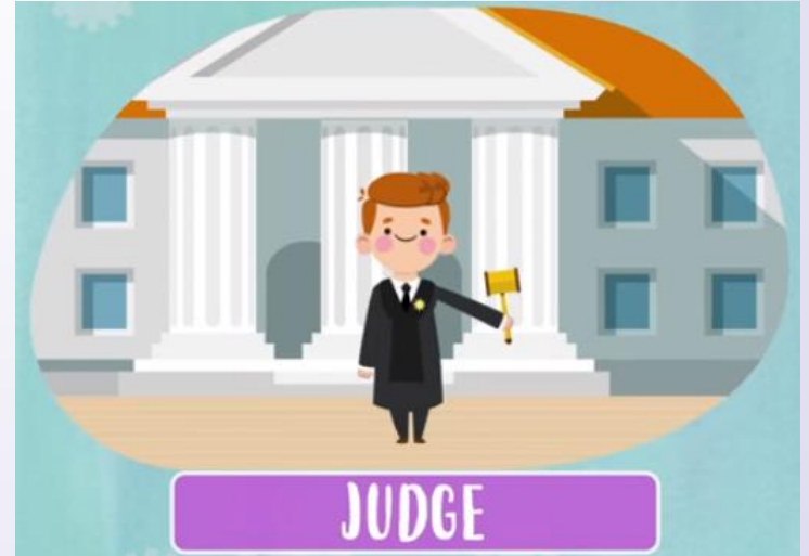
Judge ( falamos “djúdi” ) Juiz(a)