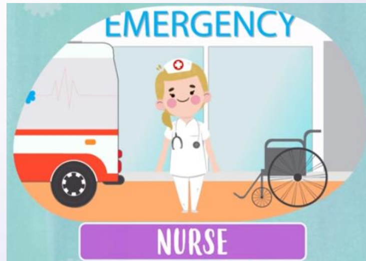
Nurse ( falamos "nãrse" ) Enfermeiro(a)