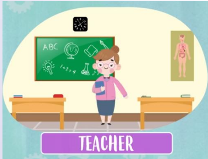
Teacher ( falamos "titchêr" ) Professor(a)