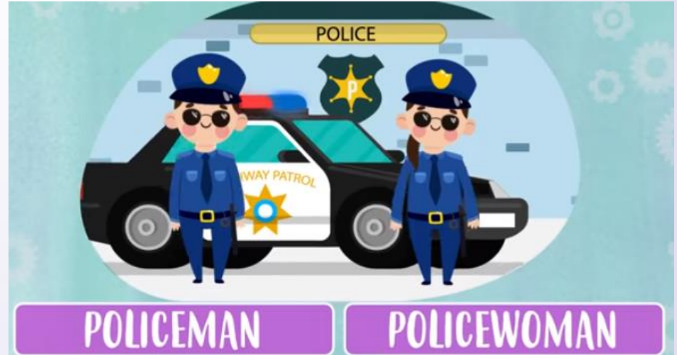
Policeman and Policewoman ( falamos "poulicemen ênd pouliceuomen" ) Policial