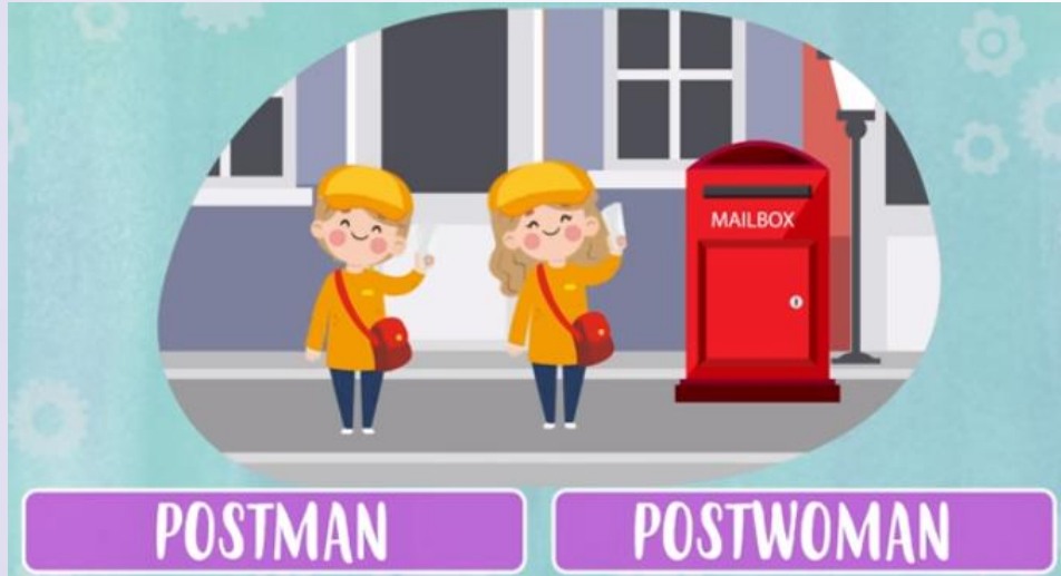
Postman and Postwoman ( falamos “poustmen ênd poustuomen” ) Carteiro e Carteira