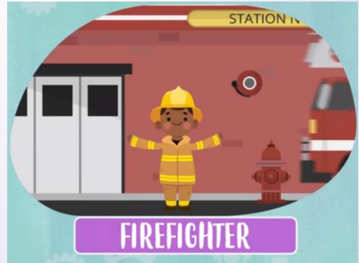
Firefighter ( falamos "faiêrfaitêr" ) Bombeiro(a)