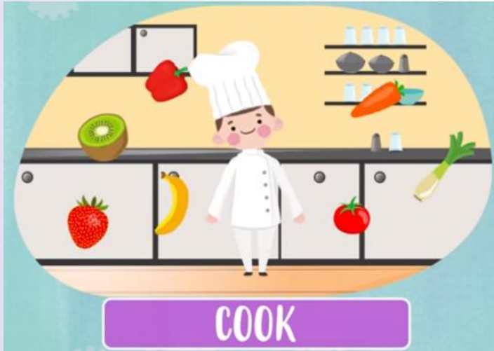
Cook ( falamos "cuuqui" ) Cozinheiro(a)