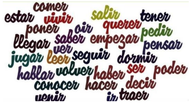
Algumas palavras em espanhol

- Português: o berço da língua portuguesa é Portugal, porém é mais falado no Brasil, onde a população atinge a marca de aproximadamente 210 milhões de pessoas. No mundo cerca de 280 milhões de pessoas falam o português.