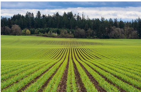
Imagem 1.