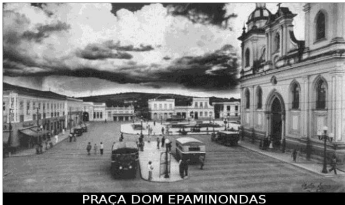
PRAÇA DOM EPAMINONDAS

3) Observe as fotos abaixo. A primeira e a segunda foto mostram a Praça Dom Epaminondas no Centro de Taubaté. Apresente as mudanças e cite pontos positivos e negativos dessas transformações.