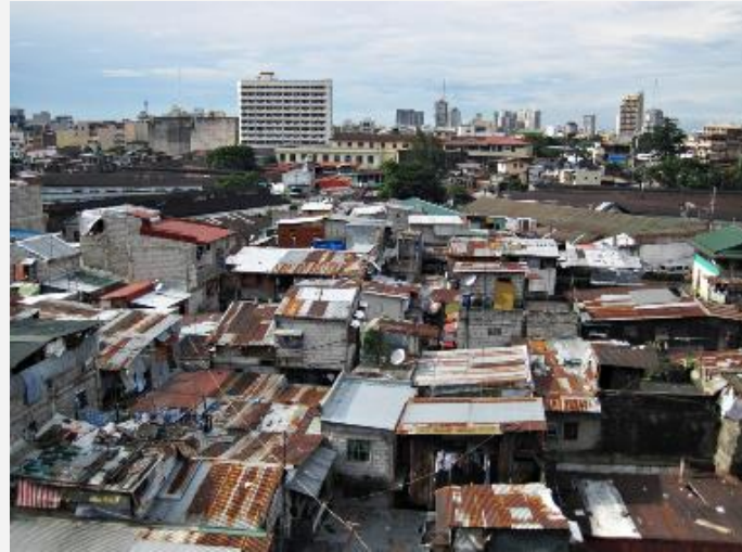
Área urbana de um município brasileiro. Exemplo de paisagem humanizada.