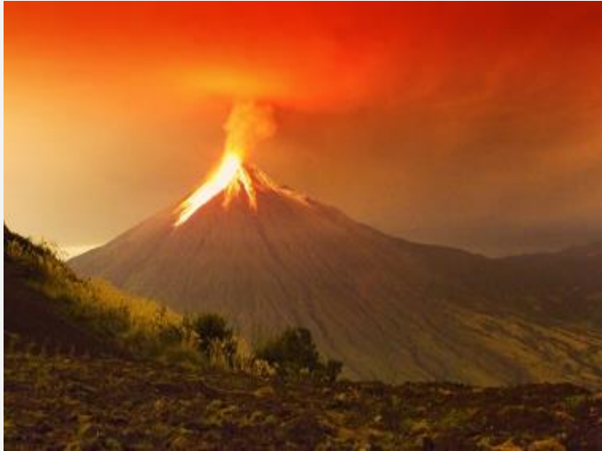
Vulcão em erupção no Equador, (2011). Exemplo de paisagem natural

Paisagem cultural ou humanizada: formada por elementos construídos pelos seres humanos.