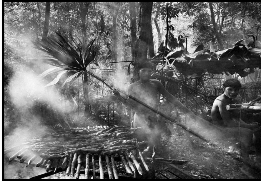
Figura 1- No kunaha, acampamento de pesca, Bambuhwa segura folha de caranaí e moqueia peixes, ao lado de Xamuwa.