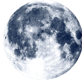
Imagem 1

Imagem 2