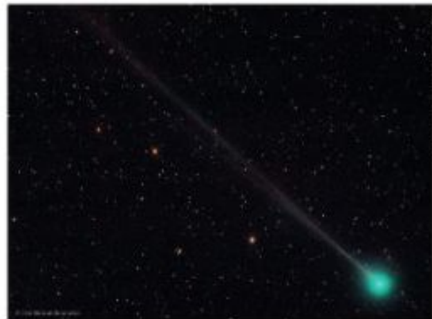
Cometa 45P visto da Terra, em 2017.

AO LONGO DO TEMPO, MUITAS TEORIAS SURGIRAM A FIM DE EXPLICAR A ORIGEM DO UNIVERSO. A TEORIA DO BIG BANG É A MAIS ACEITA ATUALMENTE. ESSA TEORIA AFIRMA QUE O UNIVERSO TERIA SURGIDO HÁ CERCA DE 13 BILHÕES DE ANOS, A PARTIR DA EXPANSÃO DE TODA A MATÉRIA QUE O COMPÕE. O UNIVERSO ESTÁ EM CONTÍNUA EXPANSÃO, OU SEJA, OS ASTROS ESTÃO CONSTANTEMENTE SE AFASTANDO.