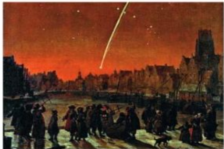
Cometa Halley sobre Roterdã no ano de 1682, óleo sobre painel, de Lieve Verschuur, 1682.

B) QUE CORPOS CELESTES ESTÃO REPRESENTADOS NA PINTURA?