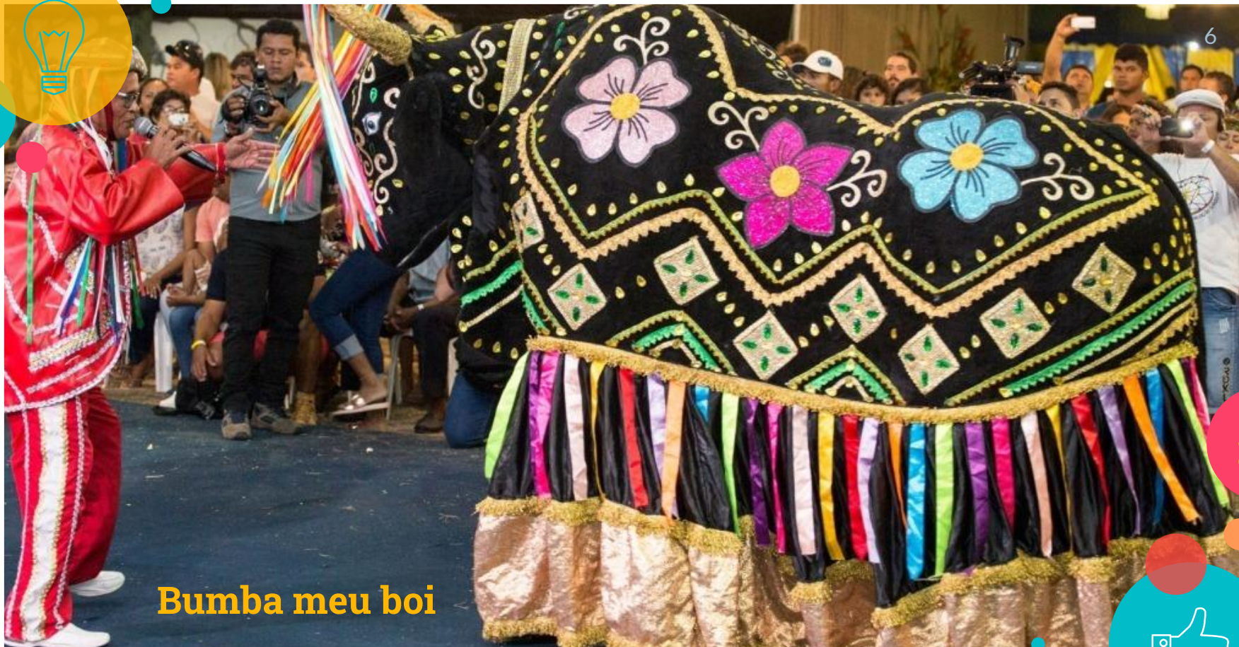
Bumba meu boi